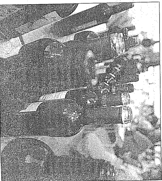
El colectivo quiere dar continuidad a la tradición recuperada de las catas.

Recuerdan que aunque el Ayuntamiento baltanasiego les brinda todo su apoyo, «sin la cooperación del pueblo, es evidente que no podemos hacer mucho».