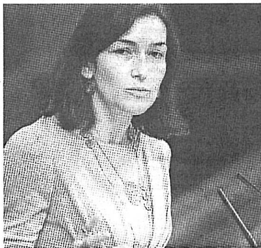
González-Sinde, durante su intervención.

EP MADRID. La ministra de Cultura, Angeles González-Sinde, recalco ayer en el pleno del Congreso que «ningún ciudadano será desconectado de Internet sin la intervención de un juez». De esta forma respondía a una interpelación urgente del PP para que el Gobierno aclare su postura en torno a la posibilidad de cerrar páginas web sin autorización judicial, tal y como recoge la Disposición Final Primera del anteproyecto de Ley de Economía Sostenible. La ministra pidió consensuar una declaración que reza: «Cultura, libre de crispación» y recordó que «plantearse que un ministro o ministra de este Gobierno pueda recortar los derechos de cualquier ciudadano, es incompatible con la trayectoria del Gobierno».